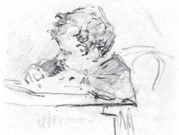
Glebus Sainciuc. Lică Sainciuc. Crochiu, sf. aa ‘40